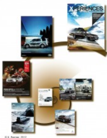
Figure 3 : Du tous espaces au tout-espace : un agencement hélicoïdal des images associées aux 4X4 dans la publicité envisagé comme gradient d'intensité du traverser (Source des images : campagnes de publicité parues dans la presse 2010/2012).

La publicité pour BMW est sans doute celle qui exprime le mieux les dimensions du traverser et celle qui illustre de la façon la plus forte la cristallisation du traverser dans l'image. Son titre suggère une succession d'« expériences » tandis que les quatre facettes de l'image disent les quatre saisons (tous les rythmes), mais aussi tous les espaces. Le véhicule tout terrain est celui du tout espace en quelque sorte. L'image condense ici toutes les traversées en ce qu'elle dit le traverser. D'un point de vue sémiotique et symbolique, le signe X des 4X4 (« Xdrive ») est le point de convergence d'une mise en tension spatiale qui se fait à partir de l'individu social ou du groupe social. L'éclatement puis la recomposition des unités d'espace en morphologies spatio-temporelles sont aussi des arrangements dans la sémiosphère. Ils participent pleinement de la mise en relation qu'est le traverser. La langue et les mots utilisés pour désigner certains véhicules sont édifiants, avec, par exemple, la figure à succès du Crossover .