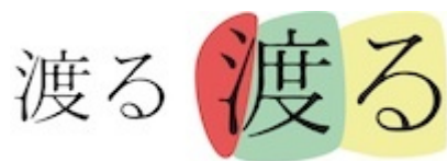
Figure 4 : Le Kanji japonais pour dire « traverser » (Wataru).

Traverser se dit aussi to go through , durchgehen , atraversar , attraversare ... qui ne sont pas des synonymes, mais des complémentaires, l'autre dimension du traverser. Les spatialités sont ici étagées, empilées et reliées selon des agencements parfois très élaborés. La forme du Kanji japonais est édifiante quand il s'agit de désigner le traverser (« wataru »). Avec toutes les précautions interprétatives nécessaires, nous suggérons que le Sanzui-Hen (surligné en rouge sur la Figure 4) tend à désigner des choses relatives à l'eau et pourrait signifier le traverser premier d'un Japon largement construit dans son rapport à la mer. Le Kanji central (en vert) évoque des « degrés » ou des multiples (« fois ») dans lesquels nous croyons retrouver les multiples spatialités et les multiples plans spatiaux. Enfin, le Hiragana « ru » (en jaune ici) est la terminaison qui désigne en japonais le verbe, l'action, la mise en mouvement.