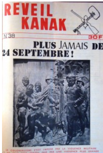
Photo 1 : La dernière couverture de Réveil Kanak en 1973. Depuis, l'orthographe a changé. Il est sous-titré par une maxime

fanonienne : « Le colonialisme s'est imposé par la violence militaire et ne peut être abattu que par une violence plus grande » (Fanon 2001, p. 61) ; « Le colonialisme n'est pas une machine à penser, n'est pas un corps doué de raison. Il est la violence à l'état de nature et ne peut s'incliner que devant une plus grande violence » (ibid.),