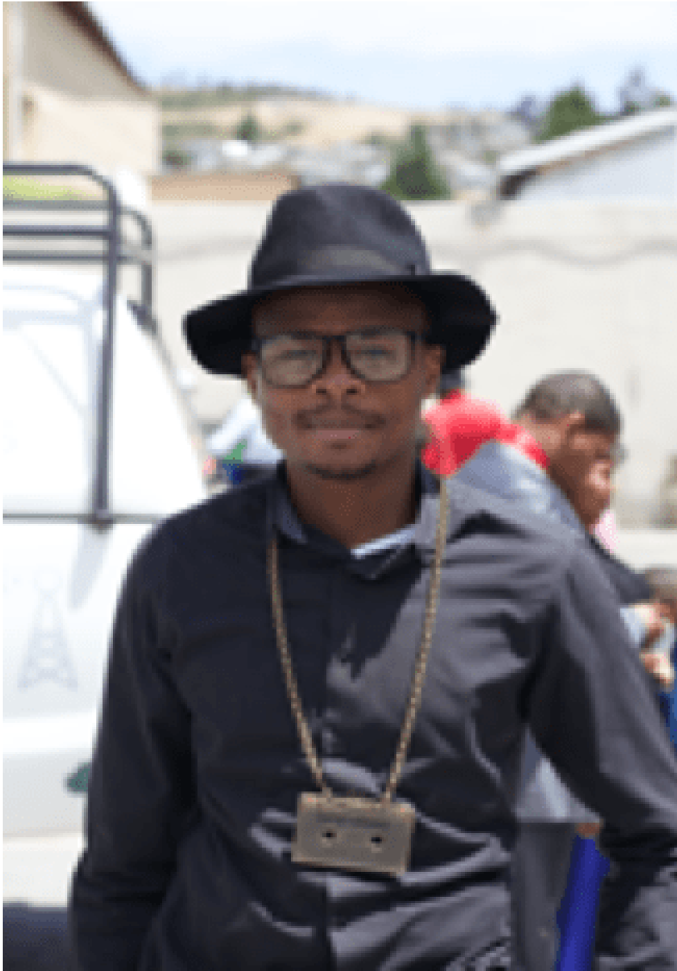
Photographies 10, 11 et 12 : podium de la Funny dressing competition.

À travers l'exemple du « pouvoir transformationnel du jeu », Erving Goffman développe sa pensée en théorisant le concept clef de modélisation. Lorsque des enfants s'amuse aux cow-boys et aux indiens, ils jouent en définitive à la guerre – ils prennent modèle sur la guerre- mais en abandonnent la plupart des attributs et des caractéristiques. Il ne viendrait pas à l'idée de l'un d'entre eux de s'en prendre gravement à un camarade ; tout comme il ne viendrait pas à l'idée d'un parent, observateur du jeu, de s'inquiéter pour la santé de son enfant : « ils ne font que jouer ». Ils appliquent à un contenu déjà signifiant -cadre primaire- un schéma d'interprétation partagé qui donne son sens à la modélisation. Ainsi, l'auteur entend par mode :