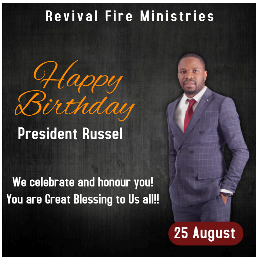
Photographie 6 : affiche publiée sur le mur Facebook du pasteur Russel.