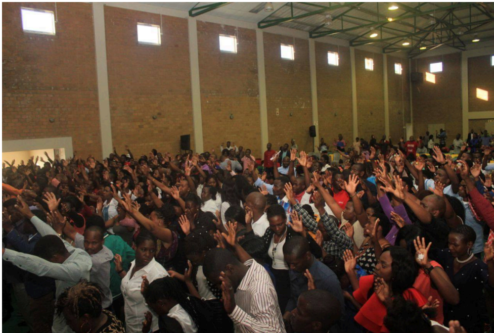
Photographie 7 : une assemblée en pleine extase collective, mais relevant pourtant d'un solipsisme.

mimesis praxeôs , c'est-à-dire représentation d'actions et mise en scène de son histoire (Aristote and Voilquin, 1998). Le récit de soi est le processus où l'individu devient sujet de sa destinée, et finalement maître de son existence (Ricoeur, 1990 ; 1991). Sans récit, la vie est dans les limbes. Elle n'advient qu'en étant contée ; à ce titre, « être en vie, c'est avoir une histoire à raconter. Être en vie, c'est précisément être le héros, le centre de l'histoire de toute une vie » (Mendelsohn et al., 2009). Le pasteur Russel et ses apôtres mettent en scène dans une mise en abyme le storytelling capitaliste de la société sud-africaine à travers le récit de fidèles ayant connu une ascension sociale. Ce alors que la nation arc-en-ciel a connu au début des années 1990 une transition démocratique et une ouverture économique au monde (Bond, 2000). Au risque que l'on passe d'un apartheid de races à un apartheid de classes (Seekings and Nattrass, 2005), fussent ces deux notions inextricablement enchevêtrées de manière ostentatoire en ces sociétés périphériques.