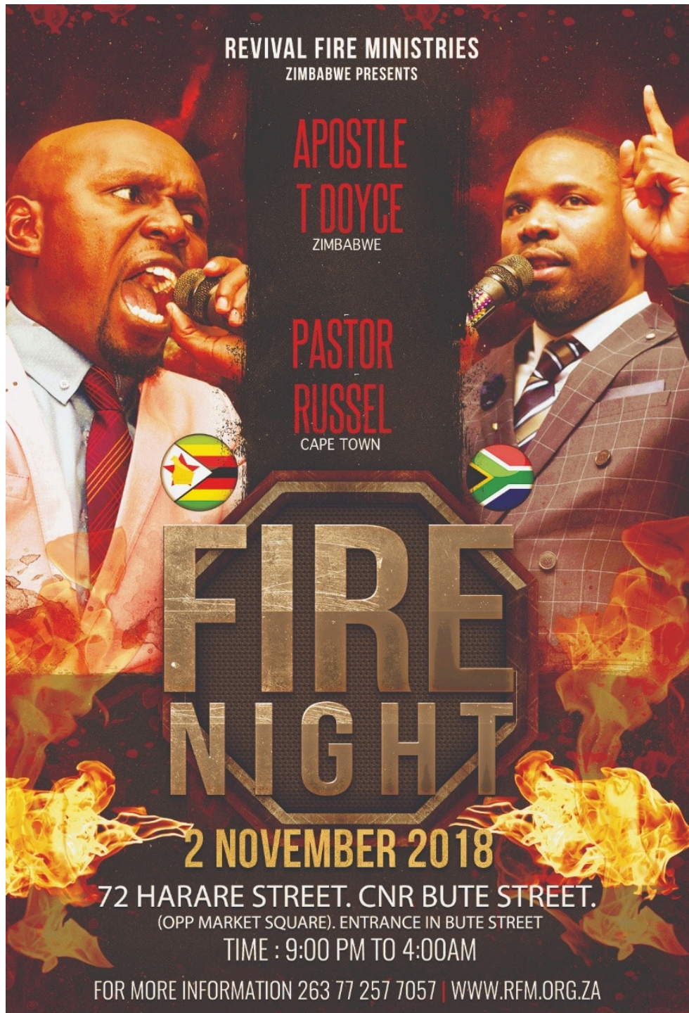
Photographie 4 : Flyer du pasteur Russel pour la promotion de ses shows religieux.

Celle-ci recouvre plusieurs ordres au sein desquels circulent ses fidèles si bien qu'ils s'auto-entretiennent. La première dimension de l'émancipation relève du domaine socio-économique puisqu'il vante la réussite matérielle dans une verve capitaliste. Autre mission qu'on peut qualifier de séculaire, celle de divertir ses fidèles en proposant, durant les cérémonies, ce qu'un de ses membres qualifia de « parenthèses enchantées ». Au demeurant si le pasteur fait prévaloir une logique individualiste dans la réalisation de l'existence de ses coreligionnaires, chacune d'entre elles se nourrit du reste de substantifiques échanges collectifs avec l'ensemble de la communauté qu'il préside et structure par des entrelacs festifs.