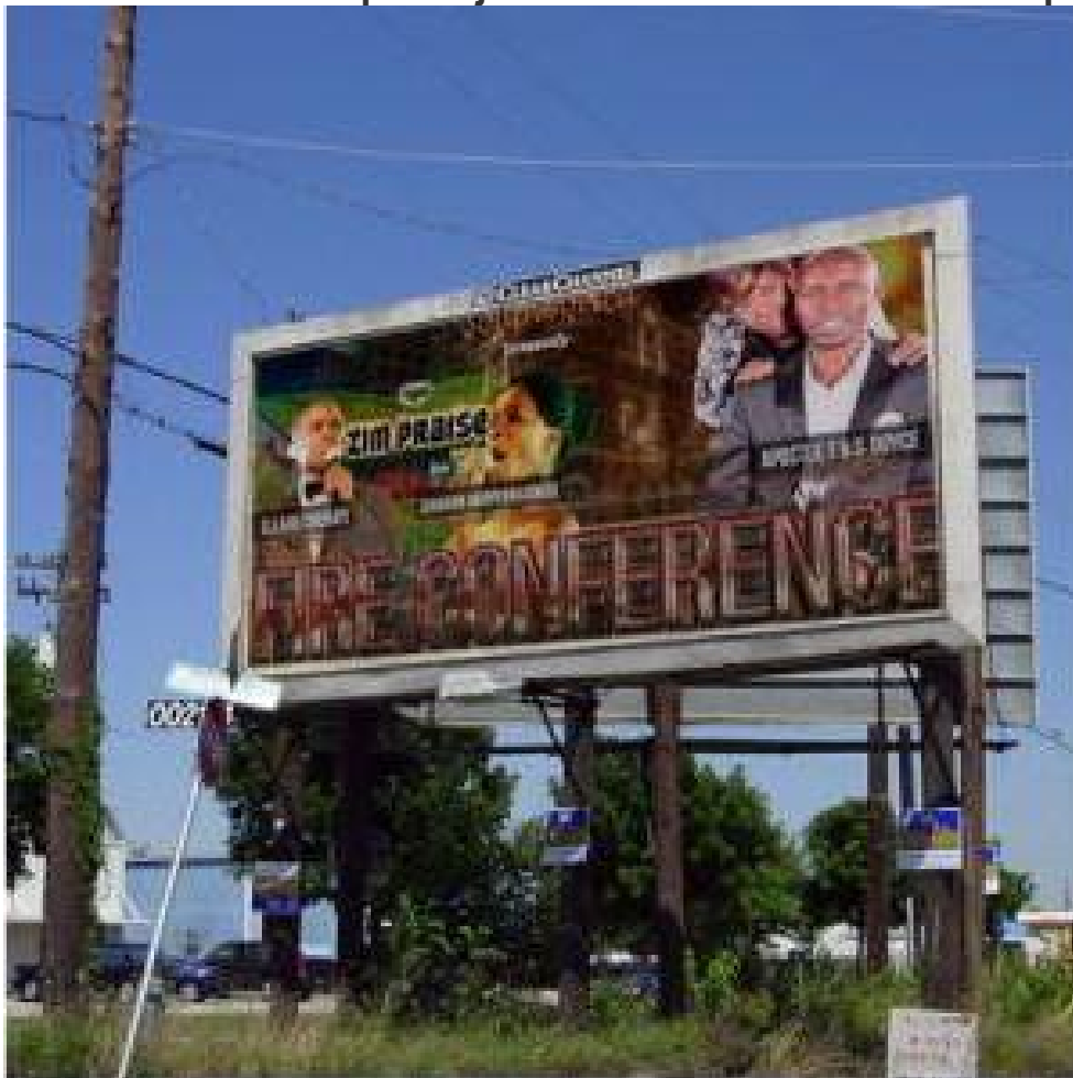
Photographie 9 : une affiche de la RFM dans la périphérie de Stellenbosch.