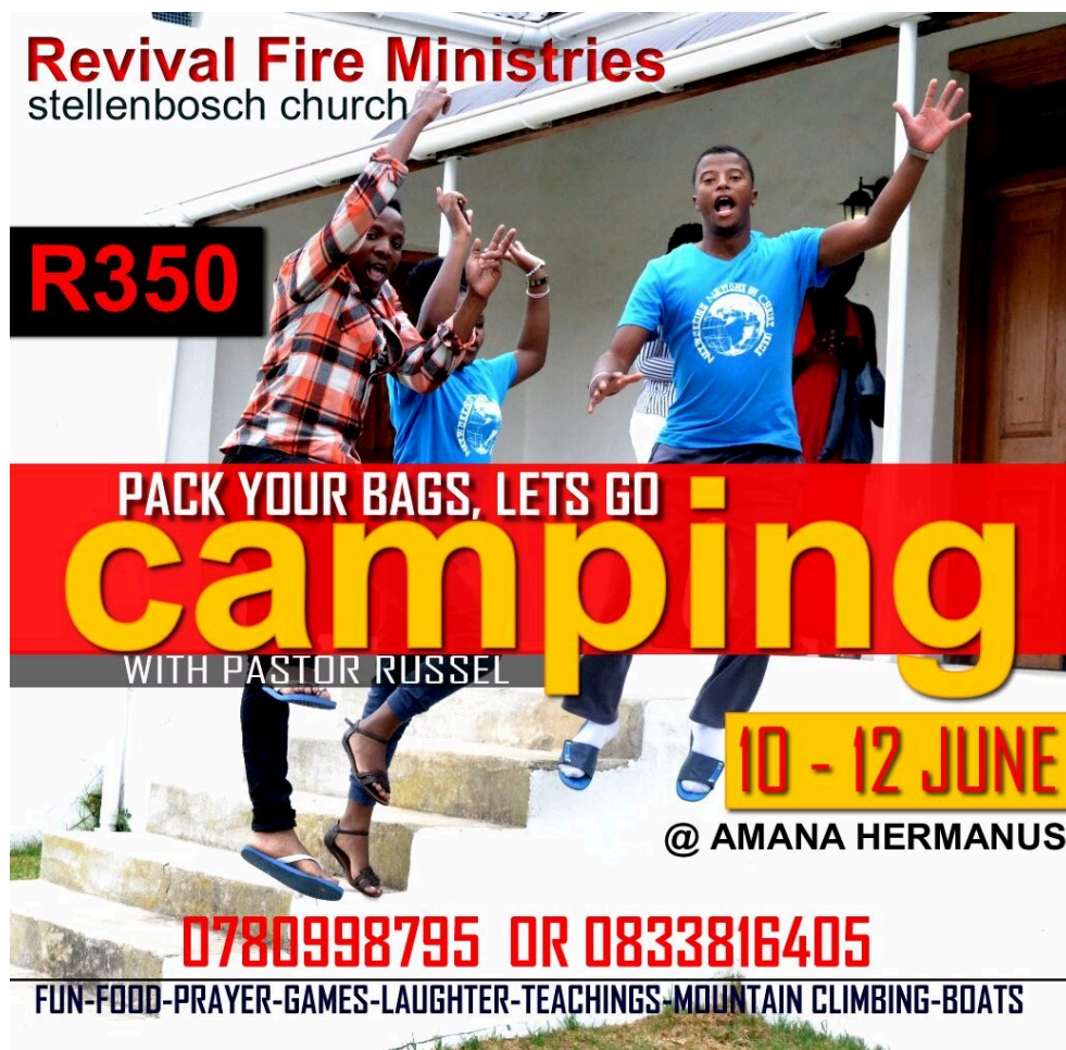
Photographie 8 : Flyer façonné par le pasteur Russel proposant un week-end en camping.