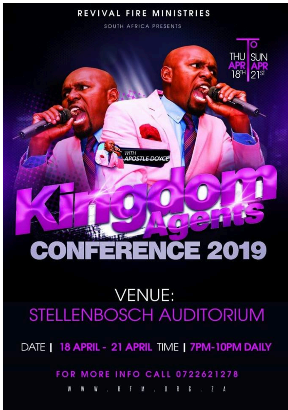
Photographie 13 : flyer de la RFM.

L'homme moderne, qualifié sans doute trop hâtivement et simplement par Mircea Eliade d' « areligieux », n'a pas toutefois pour autant éliminé entièrement la religiosité. En effet, convient néanmoins M. Eliade, conserve-t-il des traces de celle-ci, qui perdure dans « le temps des réjouissances et du spectacle, et du temps festif » (Eliade, 1967 : 153). Or, la fête, parce qu'elle obéit à de tout autres règles qu'à celles ordinairement instituées, est, au sens strict, quelque chose de « séparé », c'est-à-dire littéralement de « sacré » puisque ce terme vient du latin sacer signifiant « ce qui est séparé ». Roger Caillois justifie donc également sa nature sacrale, tant elle représente « un tel paroxysme de vie et tranche si violemment sur les menus soucis de l'existence quotidienne » (2015 : 98). Aussi apparaît-elle « à l'individu comme un autre monde, où il se sent soutenu et transformé par des forces qui le dépassent » (2015 : 149). De là cette activité ludique