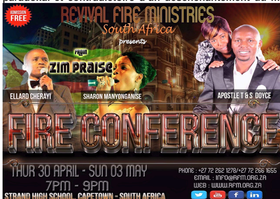
Photographie 14 : Flyer flamboyant et alléchant d'une « conférence » gratuite.