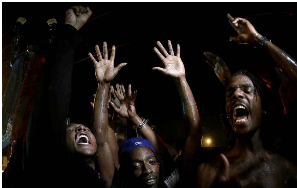
Photographie 17 : une scène de transe collective.

Similairement dans la Weltanschauung pentecôtiste le corpus mysticum et le sacrum imperium se sont projetés dans le marché. Ce car de sa pneuma émane invariablement la plénitude de puissance du Christ, qui dorénavant fait découler le salut de l'amour de l'argent propre au culte du capitalisme. Jung avait semblablement associé, en la déité du temps grec Aïon, l'éternité et l'autonomie en l'archétype du Christ. La félicité observée s'expliquerait ainsi par la sensation d'éternité qui saisit chaque fidèle à mesure qu'ils s'arrachent aux déterminismes anxiogènes. Ainsi cette lecture jungienne nous permet d'expliquer d'une part la dissipation de l'angoisse, fût-elle partielle. D'autre part perçoit-on dans l'association iconoclaste du Christ au capitalisme la persistance du théologico-politique relevée par Marcel Gauchet (qui procède donc paradoxalement d'une sortie du religieux et de « l'éclipse du politique »). La béatitude observée s'expliquerait ainsi par la sensation d'éternité qui saisit chaque fidèle à mesure qu'ils s'arrachent aux déterminismes anxiogènes.