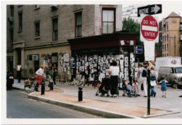
Illustration 4 : Réseaux d'écriture dans toute la ville, New York (2001).

Pendant cette phase d'action, les transformations de l'espace s'imposaient à tous : la ville était coupée en deux, le sud de Canal Street étant interdit à la circulation des voitures et des personnes. Les lignes de métro partiellement détruites dans le quartier des tours connaissaient d'importantes perturbations. Face à ces bouleversements de l'unité et de l'identité spatiale de la ville, le semis des écrits pouvait apparaître comme une manifestation des pouvoirs de pharmakon reconnus à l'écriture (Detienne 1988, p. 33)[1]. L'affichage massif des écrits dans les rues, l'installation de lieux d'écriture, la mise en place d'autels offrant à la lecture leurs messages répétitifs, tout cet attirail graphique ne recomposait-il pas — à peu de frais et provisoirement — la circulation des idées, des affects, des personnes dans la ville, à échelle humaine ?