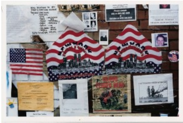
Illustration 2 : Multiplicité des écrits affichés. Avenue A, New York (2001).

La plupart des écrits ont été fabriqués à la hâte, sans soin sur des supports fragiles, les graphies sont souvent brouillonnes (Illustration 3).