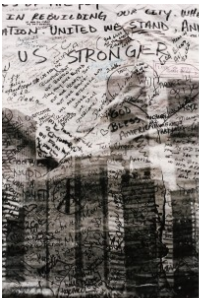
Illustration 7 : Grand panneau à écrire mis à la disposition des passants, New York (2001).

Il en va ici comme de nombreuses formes d'écriture collectives typiques, celle des pétitions, par exemple.