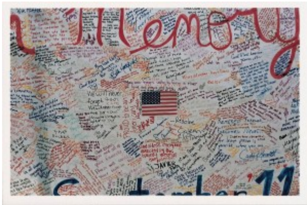
Illustration 6 : Légende. Source : Grand panneau à la mémoire des morts du 9/11, New York (2001).

entre le « We » des énoncés et la signature individuelle pouvait être source de confusion, mais ramenés à leur réalisation graphique, les énoncés écrits sur les panneaux, banderoles, registres rendent visibles une sorte de marqueterie d'écritures et de signatures, qui a la particularité de pouvoir être vue comme l'œuvre d'un collectif et comme l'agrégat de plusieurs signes individuels.