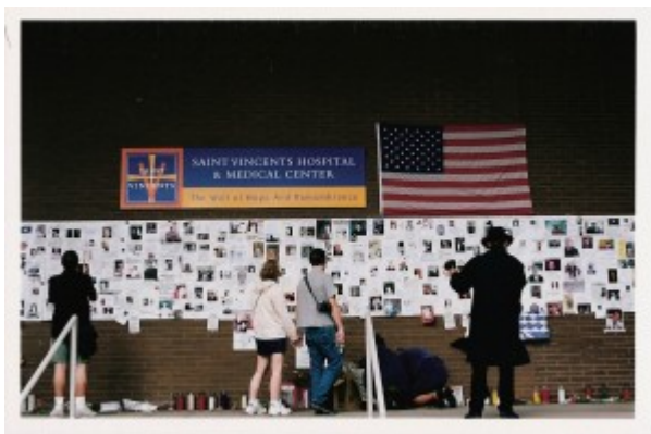
Illustration 1 : Affichage de « Missings » à l'hôpital Saint Vincent, New York (2001).

Les « écrits de septembre » se caractérisent tout d'abord par leur ampleur puisque ce sont des millions de messages qui ont été affichés à l'échelle de toute une ville. Ils sont aussi d'une grande diversité : les « missings », ou affiches de recherches de disparus, côtoyaient les déclarations les plus générales comme « God bless America », les demandes de fournitures pour les secours, l'annonce de services religieux.