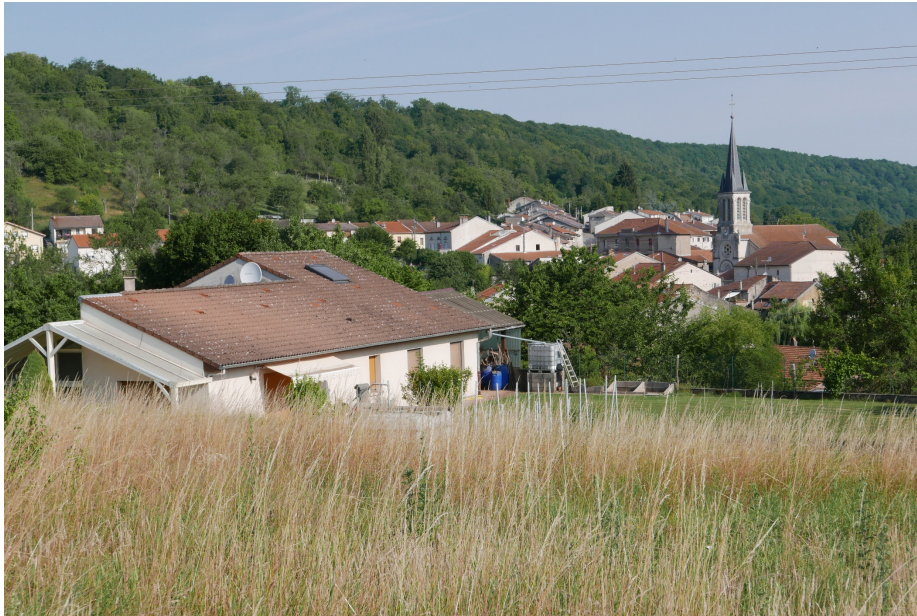
Les collines boisées environnent les villages de Chaligny, Sexey-aux-Forges et Maron.