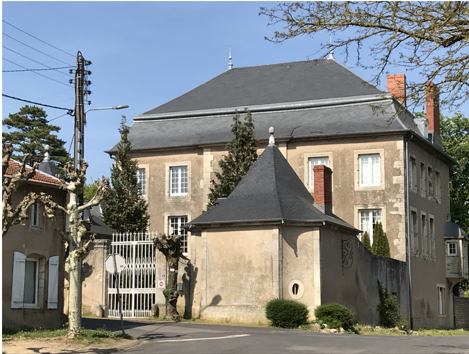
Le château d'Eulmont, datant du 18 e siècle avec son échauguette du début du 17 e , témoignant d'une construction plus ancienne.

En outre, les habitants des communes observées ont conscience de bénéficier d'une nature figée, et du même coup muséifiée, dont le coût d'entretien ne leur incombe pas, puisque, en effet, les châteaux, les paysages, les terrains de golf et autres squares arborés sont entretenus soit par les propriétaires privés, soit par la puissance publique. C'est dire si la nature, réduite ici à un poster, présente pour les gentrificateurs bien des avantages sans qu'ils aient à en subir les inconvénients. À cet égard, il est important de souligner que ce n'est pas l'ensemble des première et deuxième couronnes périurbaines de Nancy qui se gentrifie, mais bien plus des communes qui, à travers leurs atouts patrimoniaux, architecturaux et environnementaux, s'apparentent, totalement ou partiellement, à des niches de gentrification périurbaine.