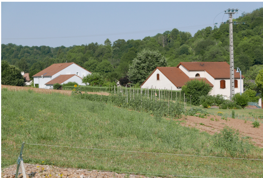
Les collines boisées environnent les villages de Chaligny, Sexey-aux-Forges et Maron.