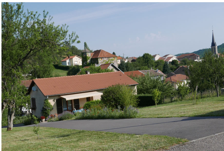
La nature bien présente à Chaligny.