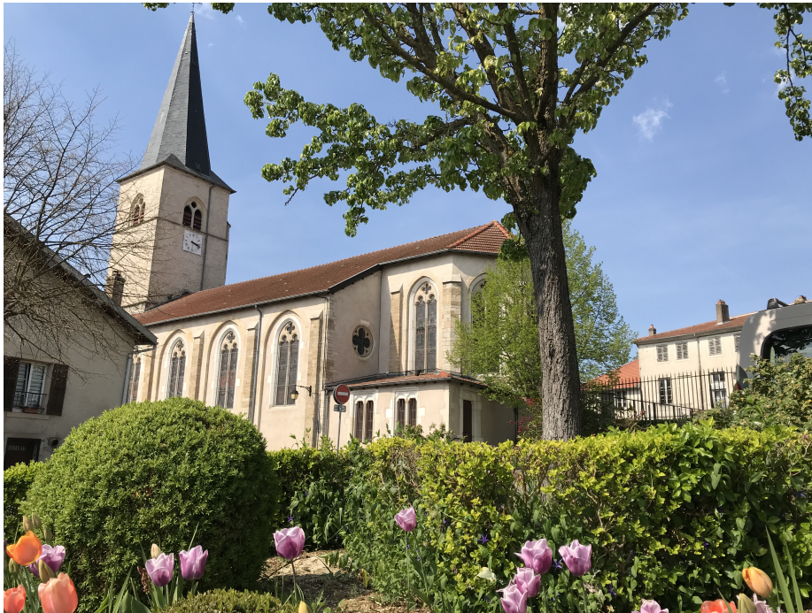
L'église Saint-Christophe avec son clocher datant du 12 e siècle, dans la commune de Lay-Saint-Christophe.