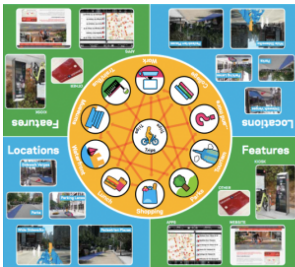
Image 2 : Plateau de jeu utilisé pour les ateliers de conception participative du système de bike share.