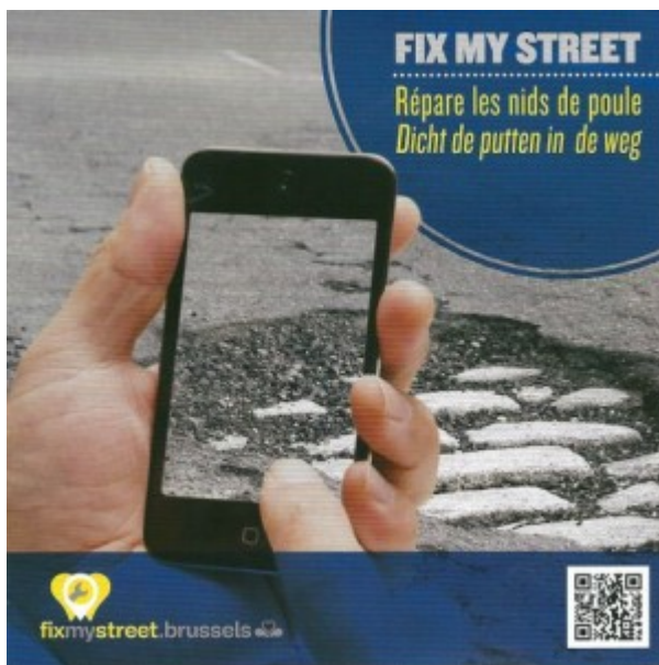
Image 3 : Affiche publicitaire de FixMyStreet Brussels.