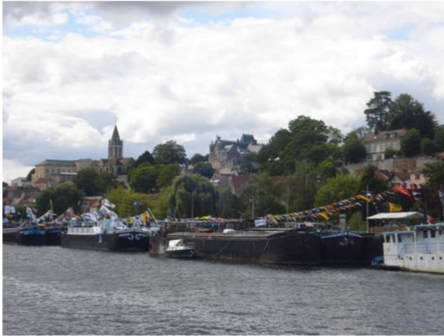
Photo 4 : Pardon de la batellerie à Conflans-Sainte-Honorine, 2011.

de son territoire n'est donc pas partagée avec les « gens d'à terre ». C'est un trait majeur de cette urbanité.