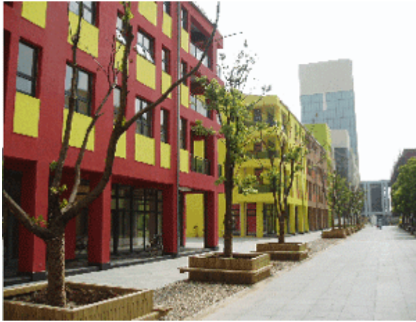
Abb.2: Dekorationslose Giebelfassaden an Wohngebäuden mit Gewerbeflächen im Parterre.

Anting wirkt überraschend offen, Mauern und Zäune vor Wohnquartieren sind nicht vorhanden. Man hat offenbar ernsthaft versucht, die Idee der deutschen bzw. europäischen Stadt der Erde von Jiading aufzuprägen – und dieser Versuch ist, was die genannten Strukturen betrifft, in gewissem Umfang, sozusagen ‘in abstracto’, gelungen.