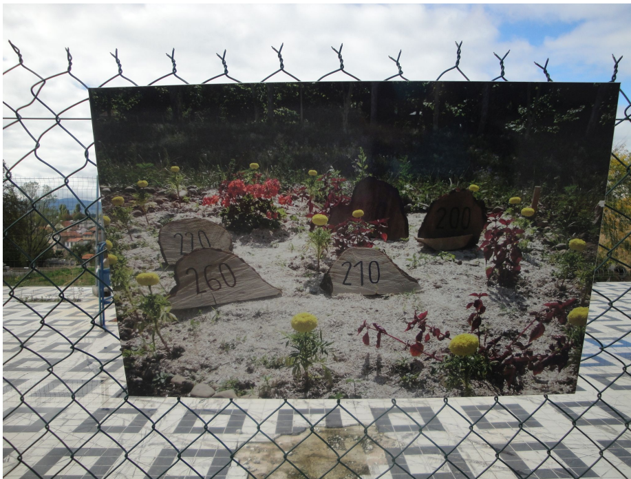
Action mémorielle au quartier du Plateau, La Duchère, 2012.