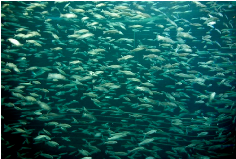
Image 6 : Banc de poissons dans un grand réservoir cylindrique à Loro Parque, Tenerife (2007).

Le propos est donc de souligner le fait que l'impossibilité de la ville ne signifie pas que le commun et sa figuration sont rendus impossibles, mais qu'ils sont réalisés et à inventer autrement sans monopole et sans uniformité, sans limites virtuelles 7 , mais avec des limites actuelles 8 , donc illimités et protéiformes. Finalement, la figuration de la contre-ville urbaine offrirait un outil pour suivre les variations et les variétés du faire commun . La contre-ville ne serait pas radioconcentrique, elle ne serait pas non plus informe, elle serait protéiforme , foisonnante de polarités, instable et éminemment liquide .