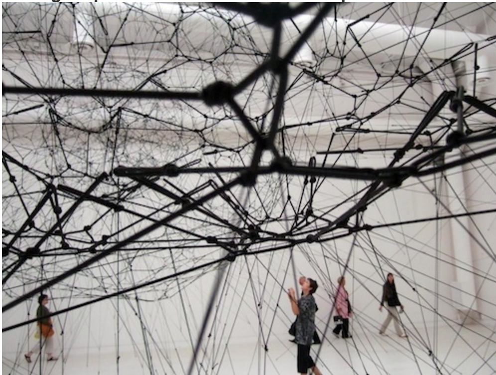
Image 8 : « Galaxies Forming along Filaments, Like Droplets along the Strands of a Spider's Web », Tomas Saraceno (2009)

La figure de la contre-ville est sans référent, indéterminée, diverse, devenir des interrelations des éléments entre eux. Les flux constituent une signature urbaine fluctuante et propre à chaque aire urbaine suivant les rapports entre le bâti et les mobilités, le solide et le liquide. Il n'y a pas plus d'urbain générique ou standard que de vivant standard ou générique, quand bien même le bâti est