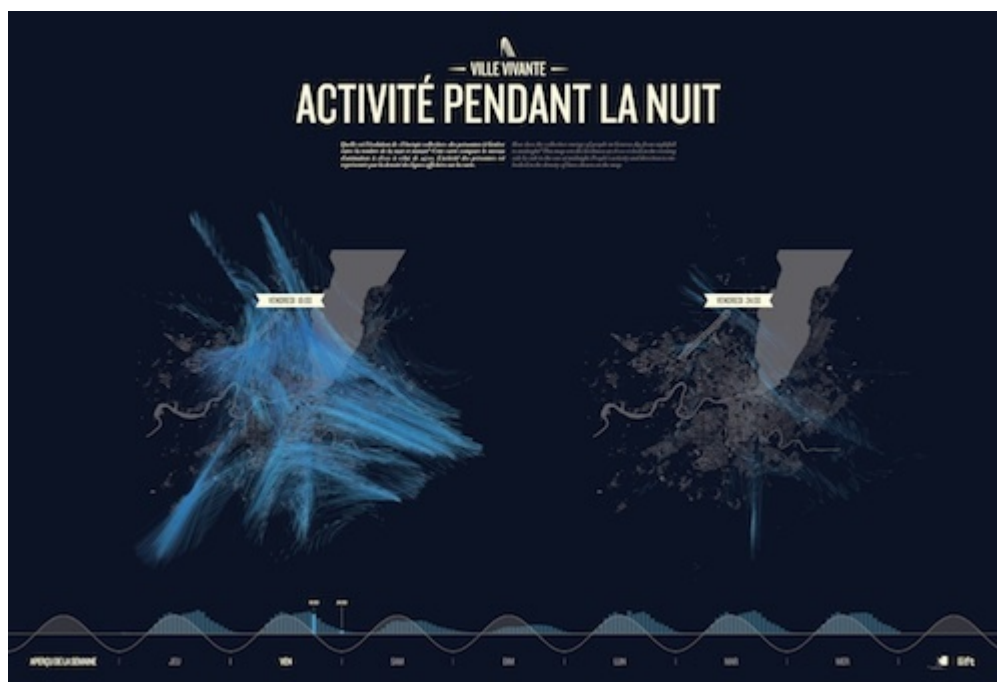
Image 7 : Empreintes numériques des téléphones portables Swisscom à partir du territoire de la ville de Genève, Activité pendant la nuit.

La figure ainsi proposée ne rappelle plus, ne représente plus une réalité fixe, mais présente à un instant précis l'état actuel d'un agencement empli de virtualités. Cette figure stratifiée et processuelle est aussi le résultat des mouvements des acteurs, qu'ils renseignent la figure ou bien qu'ils soient simplement inclus en elles. C'est la formalisation d'un agencement vivant.