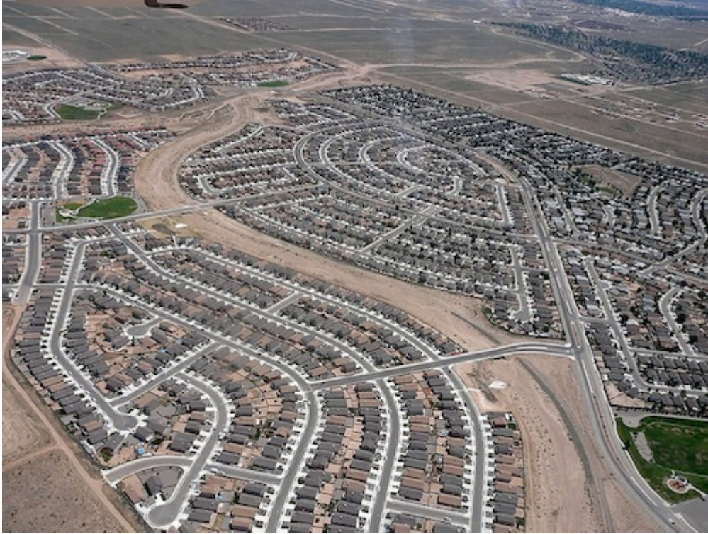
Image 4 : « Rio Rancho Sprawl », Nouveau Mexique. Bradly Salazar (2009).