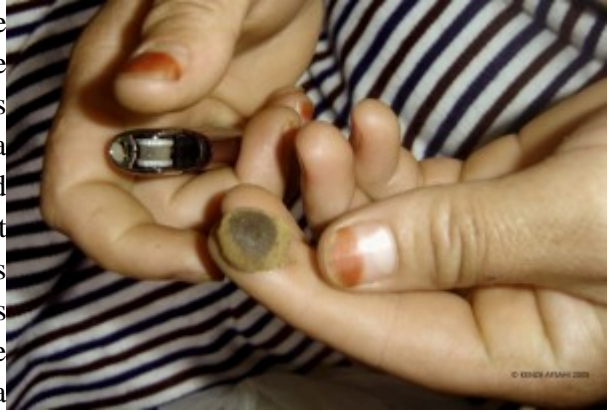
Image 3 : Mains d'une femme montrant un morceau de haschisch de qualité supérieure dans le « bled du kif ».

L'État a également participé à la création d'une identité spécifique par la tolérance historique de cette culture dans le Rif central. Les campagnes d'éradication du cannabis et de lutte contre sa propagation sur d'autres territoires du Nord (notamment dans la région de Jebala) permettent de comprendre cette dynamique. Les lançements de ces campagnes sont souvent accompagnés d'une classification que l'État opère, qui divise les territoires de culture en deux catégories : la zone historique et les nouvelles zones de culture 15 . Ces campagnes de lutte contre le cannabis, concernant en priorité les espaces nouvellement atteints par cette économie, ont permis au Rif central, et plus précisément aux Ketama et aux Ghomara (épargnés par cette politique en raison de l'enracinement de cette tradition agricole), de se forger une identité commune tout en valorisant les tolérances historiques. Par ailleurs, les Ketama et les Ghomara utilisent cette exception politique pour souligner l'authenticité et la « valeur ajoutée » du cannabis qu'ils cultivent par rapport à celui qui provient des autres territoires. Cette classification selon les zones de culture, devenue institutionnelle, cache en réalité des enjeux socio-économiques, des stratégies et des formes de résistance que les acteurs de l'espace historique de culture mobilisent pour élargir leur périmètre de culture (diffusion du savoir-faire, mobilité des acteurs, locations de terres, etc.).