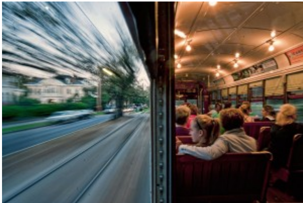
Photo 1 : Le tramway de La Nouvelle-Orléans (Louisiane/États-Unis)

Responsable éditoriale , le Tuesday 22 October 2013