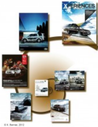
Figure 3 : Du tous espaces au tout-espace : un agencement hélicoïdal des images associées aux 4X4 dans la publicité envisagé comme gradient d'intensité du traverser (Source des images : campagnes de publicité parues dans la presse 2010/2012).

La publicité pour BMW est sans doute celle qui exprime le mieux les dimensions du traverser et celle qui illustre de la façon la plus forte la cristallisation du traverser dans l'image. Son titre suggère une succession d'« expériences » tandis que les quatre facettes de l'image disent les quatre saisons (tous les rythmes), mais aussi tous les espaces. Le véhicule tout terrain est celui du tout espace en quelque sorte. L'image condense ici toutes les traversées en ce qu'elle dit le traverser. D'un point de vue sémiotique et symbolique, le signe X des 4X4 (« Xdrive ») est le point de convergence d'une mise en tension spatiale qui se fait à partir de l'individu social ou du groupe social. L'éclatement puis la recomposition des unités d'espace en morphologies spatio-temporelles sont aussi des arrangements dans la sémiosphère. Ils participent pleinement de la mise en relation qu'est le traverser. La langue et les mots utilisés pour désigner certains véhicules sont édifiants, avec, par exemple, la figure à succès du Crossover .