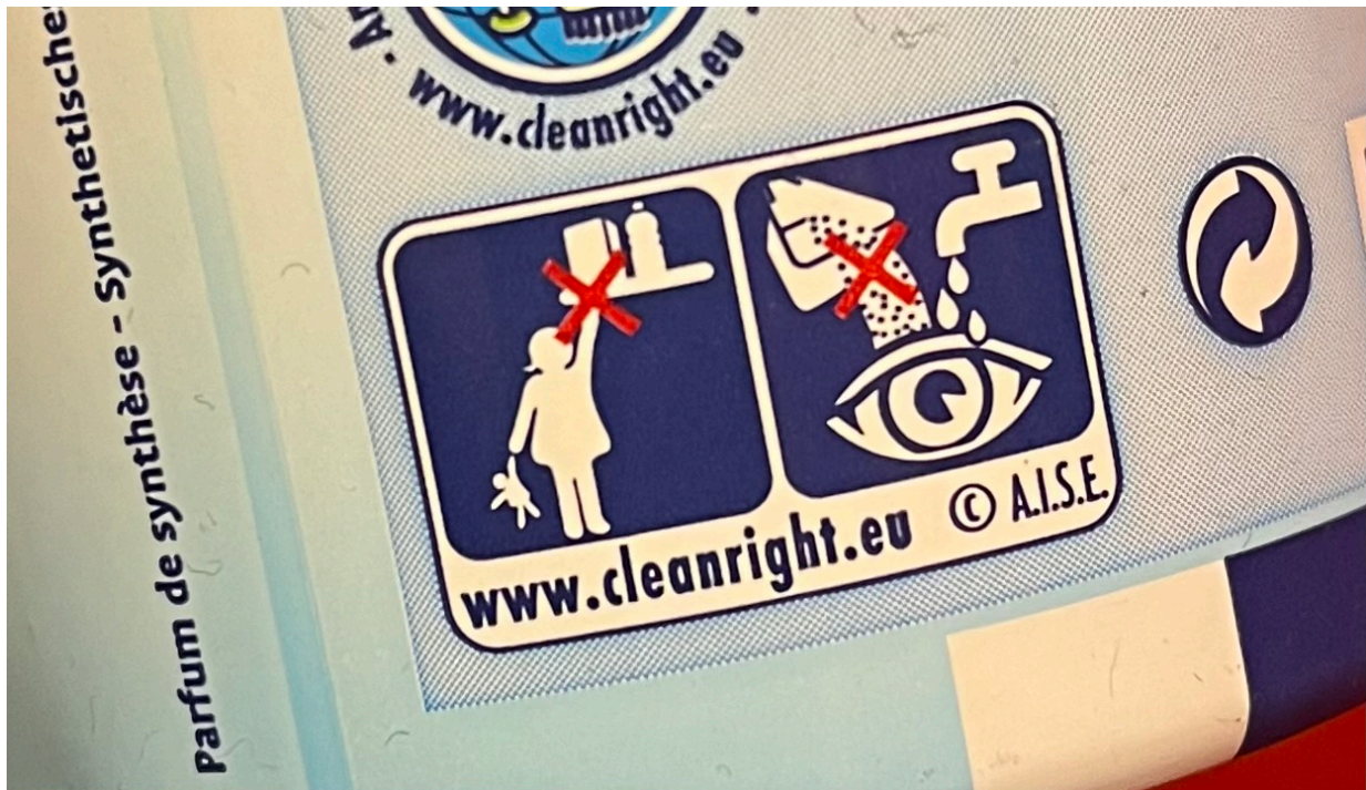
Figure 1. Pictogrammes figurant sur un désodorisant pour toilettes.

La pictographie peut-elle être inclusive ? C'est une question que l'on peut se poser quand on tombe par hasard sur un pictogramme « modernisé » voulant signifier le très classique « tenir hors de portée des enfants » ; en l'occurrence apposé sur un désodorisant pour water-closets.