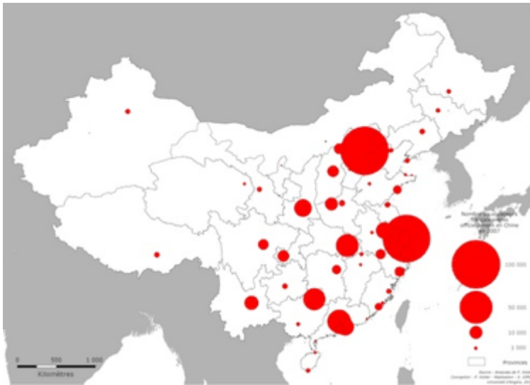
Carte 3 : nombre de touristes français recensés dans les hôtels des villes dites touristiques selon l'annuaire statistique et touristique du gouvernement chinois.