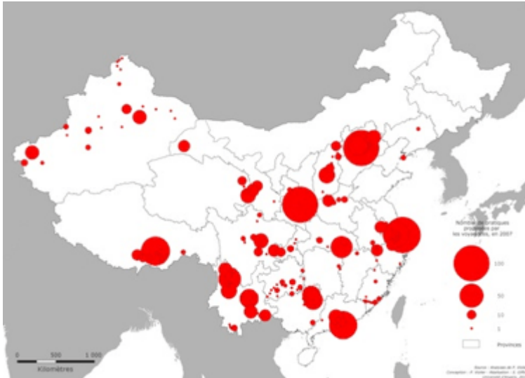
Carte 2 : fréquence des lieux cités comme siège des pratiques dans les catalogues 2007 des 17 tour-opérateurs présent sur le marché français.