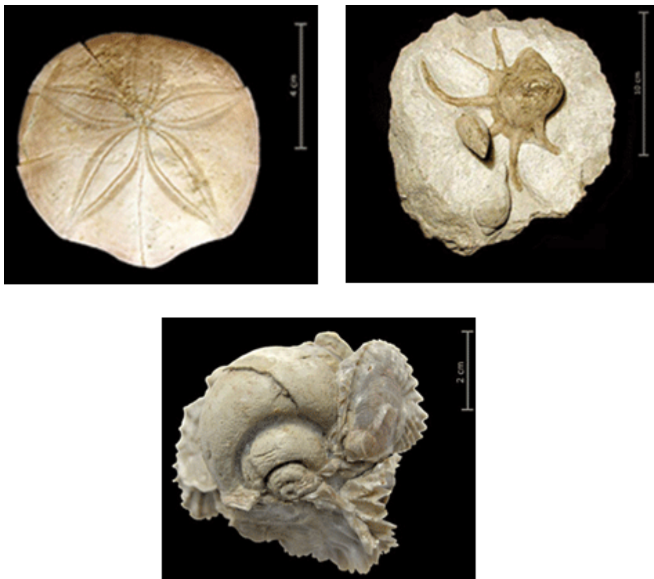
3a, 3b, 3c. Illustrations : oursin, huîtres, escargot ©OCC-SAP.

Environ 17 000 fossiles (poissons, tortues, crocodiles, coraux, mollusques, oursins, plantes, entre autres) ont été archivés dans les collections de la Paléontologie A16 (voir le site palaeojura.ch ). Intégrée à l'Office de la culture de la République et Canton du Jura, la Paléontologie A16 est basée à Porrentruy; sa mission consiste à prospecter, fouiller, prélever et documenter l'exceptionnel patrimoine paléontologique jurassien. La mise à jour de ces gisements a suscité un intérêt considérable dans la communauté scientifique internationale. De nombreux spécialistes de tous horizons sont venus à Porrentruy et dans le village voisin de Courtedoux pour observer et mesurer sur le terrain l'importance de ces découvertes. À la lecture des rapports des experts, ces fouilles recèlent un des plus riches patrimoines mondiaux en ce qui concerne le Jurassique supérieur (-161 à -145 millions d'années).