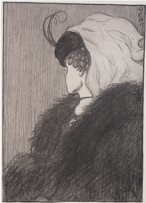
William Ely Hill, « My Wife and My Mother-in-Law », 1915.

Le dessin « My Wife and My Mother-in-Law » [1] est une illusion visuelle créée par l'artiste britannique William Ely Hill en 1915. Ce dessin est souvent associé au psychologue américain Edwin Boring (1930) qui l'a utilisé dans ses travaux sur les biais de perception et lui a donné le nom de « The Young Girl and the Old Woman ». Dans ce dessin, deux images se superposent : une jeune femme élégante vue de trois-quarts arrière et une femme âgée de profil avec un menton proéminent. Bien que principalement utilisé dans le domaine de la psychologie, ce dessin offre des analogies intéressantes pour les praticiens de l'aménagement des territoires.