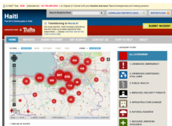
Figure 1 : « Ushahidi Haiti Crisis Map ».

L'analyse de l'interprète de cette plateforme contributive nous aide à mettre en évidence sa forte implication dans la communication du capital spatial. Premièrement, la carte est le résultat de l'effort d'un nombre élevé d'acteurs ayant des compétences et capacités différentes. Ainsi, les compétences cartographiques et « expérientielles » (référées au lieu représenté), qui ne sont pas nécessairement réunies chez une même personne, peuvent trouver une unification dans cette typologie cartographique. Deuxièmement, il est intéressant de noter que le capital spatial n'est pas nécessairement mis à disposition par un individu se trouvant à proximité topographique du lieu où se passe l'événement, ou de celui qui produit et envoie les messages de requête de secours, comme dans le cas des immigrants haïtiens aux États-Unis — l'aspect important est que cet individu est connecté et qu'il possède le patrimoine de connaissance sur le lieu.