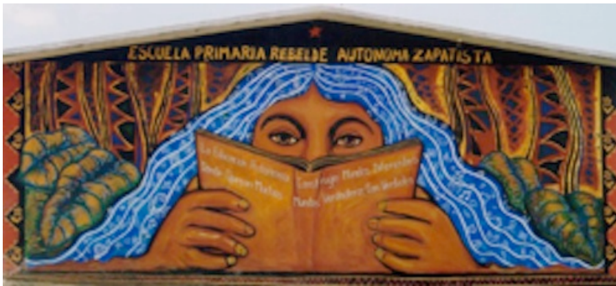
Figure 1. Photo d'une école primaire en territoire autonome zapatiste (mai 2004).

Sa principale stratégie est composée de communiqués de presse largement diffusés aux échelles locale, nationale et internationale (Galland, 2008). Le récit qui nous intéresse s'insère dans cette diffusion. Le mouvement zapatiste a sans doute été le premier mouvement social à utiliser Internet de façon massive afin de propager son message à l'échelle transnationale. Cette stratégie leur a servi : le mouvement jouit, dès les premiers jours de son insurrection, d'un fort niveau de sympathie qui oblige le gouvernement mexicain à s'asseoir avec lui pour négocier. Depuis, les dirigeants du mouvement misent sur les médias écrits, radio et vidéo, pour apparaître dans une sphère publique de laquelle ils étaient exclus.