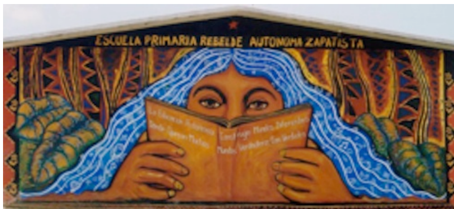
Figure 1. Photo d'une école primaire en territoire autonome zapatiste (Stéphane Guimont Marceau, mai 2004).

Sa principale stratégie est composée de communiqués de presse largement diffusés aux échelles locale, nationale et internationale (Galland, 2008). Le récit qui nous intéresse s'insère dans cette diffusion. Le mouvement zapatiste a sans doute été le premier mouvement social à utiliser Internet de façon massive afin de propager son message à l'échelle transnationale. Cette stratégie leur a servi : le mouvement jouit, dès les premiers jours de son insurrection, d'un fort niveau de sympathie qui oblige le gouvernement mexicain à s'asseoir avec lui pour négocier. Depuis, les dirigeants du mouvement misent sur les médias écrits, radio et vidéo, pour apparaître dans une sphère publique de laquelle ils étaient exclus.