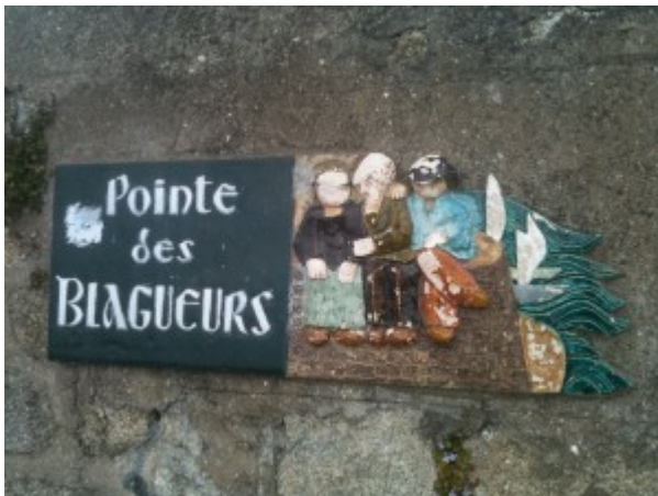
Image 1 : Pointe des blagueurs, Larmor-Plage (Morbihan).