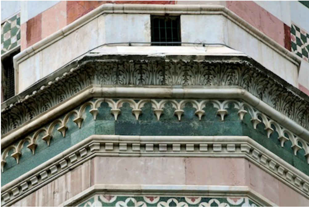
Campanile, seconde série de bandeaux et corniches, Pisano (photo Trachtenberg , p. 184).