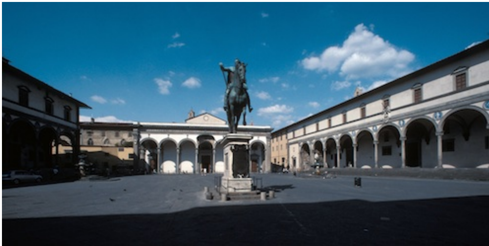
Florence, Piazza Santissima Annunziata, 13 e – 17 e siècles.