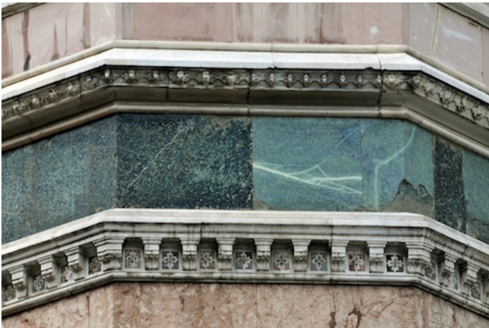
Campanile, première série de bandeaux et corniches, zone de reprise de l'ouvrage par Pisano (photo Trachtenberg , p. 184).

La grille de lecture mise en avant par Trachtenberg permet de décoder l'édifice, de le reporter aux actes qui l'ont constitué, et de comprendre ceux-ci dans leur rapport à un projet circonstanciel visant à recadrer ce qui a déjà été fait. Bien sûr, tous les exemples de cette pratique ne se présentent pas comme autant de réussites. Certains édifices sont en mal de cacher leur caractère d'assemblage. D'ordinaire, et à des degrés divers, la « rétrosynthèse » est imparfaite. Le mode opératoire de cet art de bâtir collectivement et à travers le temps laisse des traces sur le corps bâti, souvent même des cicatrices. Dès lors, il n'est pas surprenant que son désaveu fût le fait d'un humaniste prévenu par ses activités littéraires contre tout facteur susceptible de