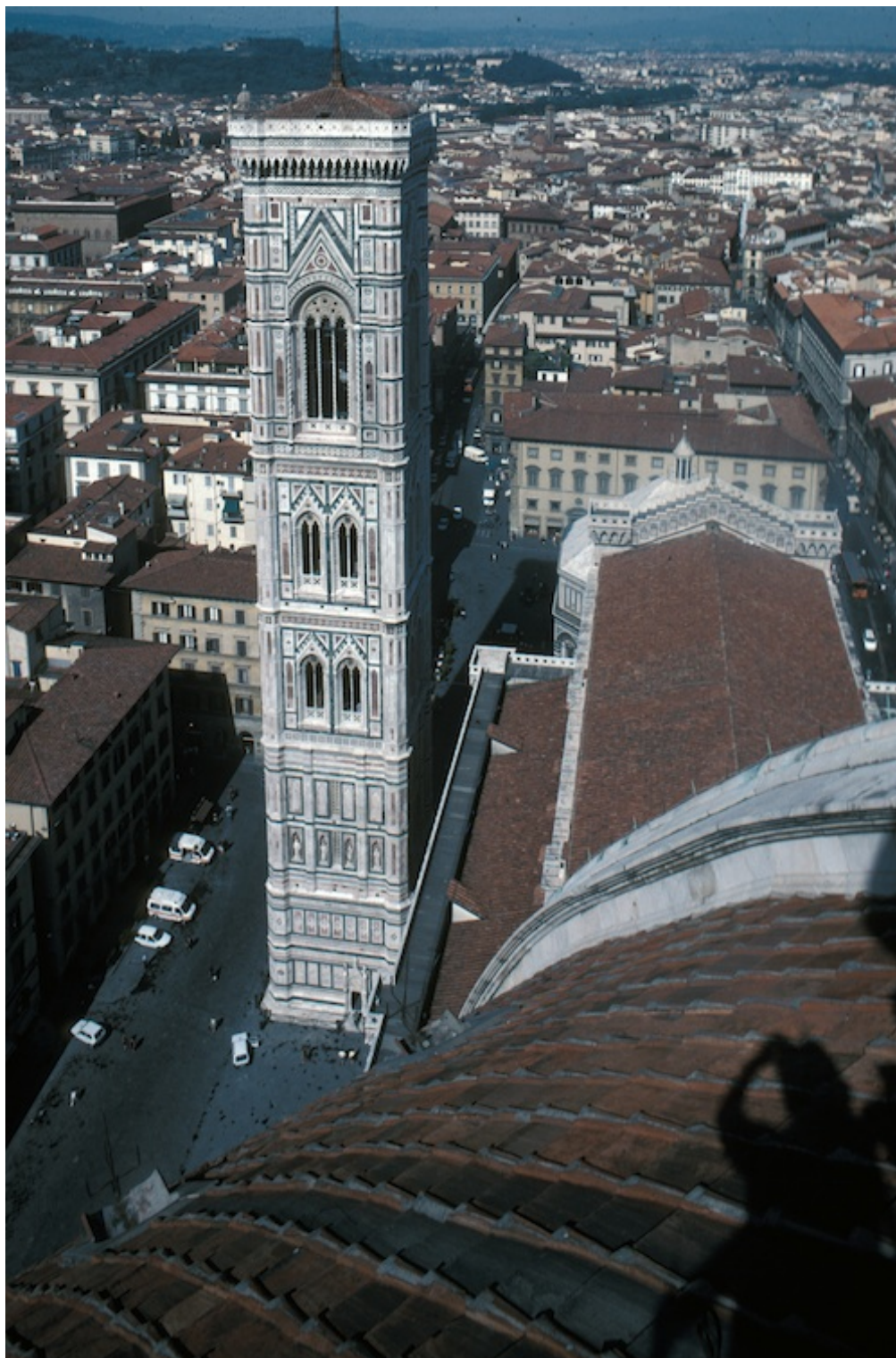
Florence, vue du Campanile depuis le sommet de la coupole (photo Trachtenberg , p. 176).

changement. Il oriente la révision, la concaténation et la progression myope vers l'objectif de l'intégrité visuelle. Même si elle est susceptible d'être soumise à des mutations ultérieures, l'œuvre doit se manifester comme une chose achevée. Ainsi « [...] l'histoire d'une construction peut être assimilée à l'histoire d'une suite de projets cohérents, tous complets et unifiés en soi, mais séquentiellement absorbés dans une nouvelle unité globale incorporant toutes les modifications précédentes ; un processus cyclique qui théoriquement pourrait se perpétuer, mais qui est inévitablement interrompu par les contingences de l'histoire » (p. 142).