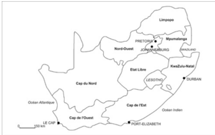
Carte 1 : Afrique du Sud.