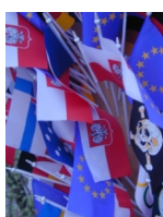
Słubice, 30 avril 2004. (4)