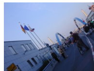
Frontière sur le pont de l'Oder, entre Słubice et Frankfurt-an-der-Oder. (2)

... Une ligne qui serpente, des drapeaux, des panneaux, un fleuve, du mouvement, à l'heure où une grande explosion se prépare... tout cela à la fois.