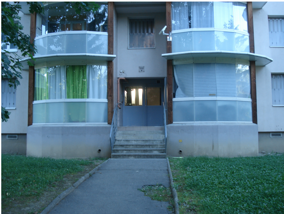
Figure 2 : Photographie des façades des logements lors des revisites ethnographiques en 2017.

Prenons le cas concret des rideaux installés par les habitants sur leurs balcons réhabilités en serres bioclimatiques. Cette pratique existante dès le gros œuvre du chantier terminé nous a été signalée pour la première fois au cours d'un entretien mené il y a dix ans avec l'architecte du projet de rénovation. Selon son concepteur, pendre des rideaux sur les vitrages empêche les rayons du soleil de préchauffer l'air entrant dans la serre, ce qui entrave la fonction prévue à un espace-tampon, celle de transition et de protection thermique de l'appartement. Minoritaires en 2007, ces pratiques habitantes, décriées par la maîtrise d'œuvre et la rationalité fonctionnaliste du système technique, se sont généralisées à quasiment l'ensemble des logements durant la dernière décennie.