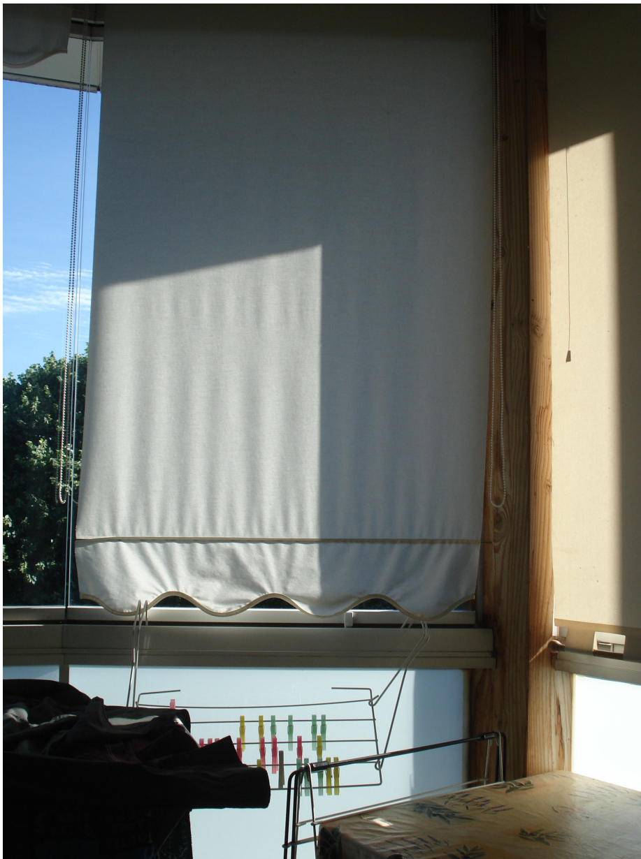
Figure 5b : Photographies prises de l'intérieur d'une serre des immeubles rénovés du quartier d'habitat social.

Dans une approche comparée de l'espace et du temps, les observations des environnements et les échanges en situation avec les habitants nous ont appris qu'il y a là un engagement actif, perceptif et pratique de l'habiter. L'espace ainsi disposé signifie plus que le seul fait de demeurer à un endroit. Il offre une vue dégagée sur les collines arborées du sud de la ville, une ouverture contemplée par les locataires sur un environnement naturel que les habitants perçoivent comme à la fois proche et lointain au quotidien, avec une place abritée des intempéries, qu'ils nous ont montrée et décrite comme accueillante, agrémentée d'un comptoir et d'un tabouret pour s'asseoir, regarder, se reposer, prendre un café, téléphoner, se manucurer les ongles, penser ou bien rêver... De l'autre côté de la serre, les rideaux sont baissés, occultant complètement la vue sur l'immeuble d'habitat social voisin, également rénové il y a dix ans. En demandant à notre hôte si nous pouvions lever le rideau pour photographier la vue sur les bâtiments, celui-ci nous a confié préférer le laisser fermé