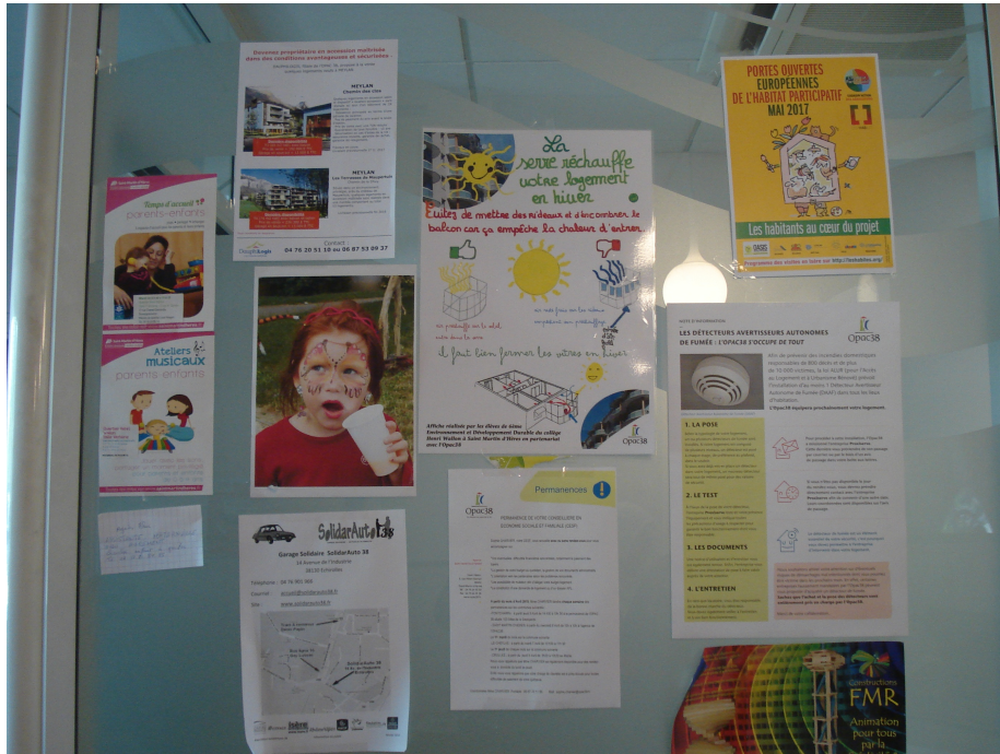
Figure 3 : Poster d'information du bon usage des balcons rénovés en serres sur le panneau d'affichage de l'agence locative du bailleur social située au cœur du quartier.

Le bailleur social, dont une des agences locatives est située en plein cœur des immeubles, peut difficilement ignorer ce processus croissant et occultant. Il avait été jugé « contre-performant » en termes d'économie d'énergie, lorsque nous avons effectué un entretien suivi d'une visite du quartier avec le chef de projet représentant la maîtrise d'ouvrage au début de l'année 2007. L'usage de rideaux avait alors été caractérisé par un manque d'informations. En dix ans, cette propension à ne pas faire ce qui a été planifié est devenue la cible de dispositifs spécifiques de communication des « bonnes pratiques ».