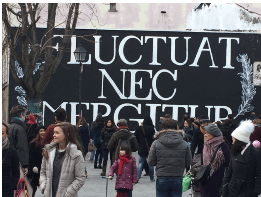
Figure 1 : Paris 10e arrondissement, après les attentats du 13 novembre 2015.

Les attentats parisiens du 13 novembre constituent un événement mondial à plusieurs titres : des attentats commis par un groupe multinational dans une ville-Monde, un crime contre l'humanité, un retentissement planétaire. Comme souvent, ce qui est mondial est aussi interscalaire et nous parle aussi de ce qui n'est pas mondial, ici : Paris, la France, l'Europe. Ces échelles entrelacent une multiplicité de métriques et beaucoup d'entre elles se déploient dans l'événement, un fait social total de la société-Monde.