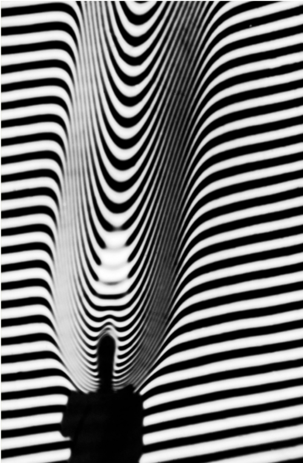
Image de phase et image d'amplitude. L'image interférentielle de la flamme d'une bougie a été obtenue dans la cavité d'un interféromètre de Michelson par Maurice Françon et ses collaborateurs. C'est un espace où, par l'intermédiaire de franges alternativement claires et sombres, s'inscrit la phase des ondes lumineuses. Cette manière d'imager permet de visualiser le mouvement thermique de l'air, milieu

transparent, autour de la flamme : les variations d'indice de réfraction de l'air dues aux échauffements locaux changent la vitesse de propagation et donc la phase des ondes qui s'y propagent. Les franges suivent alors les hétérogénéités thermiques du milieu transparent et fournissent une « image de phase » de ce milieu. (Expérience et photographie de Maurice Françon et de son équipe ; collection d'enseignement du Laboratoire d'Optique des Solides de l'Université de Paris VII ; avec l'aimable autorisation de Jean-Marc Frigerio et Jacques Lafait)