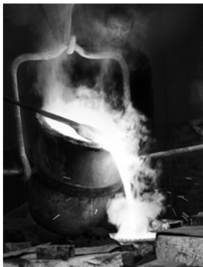
Un métal en fusion peut émettre beaucoup de lumière.