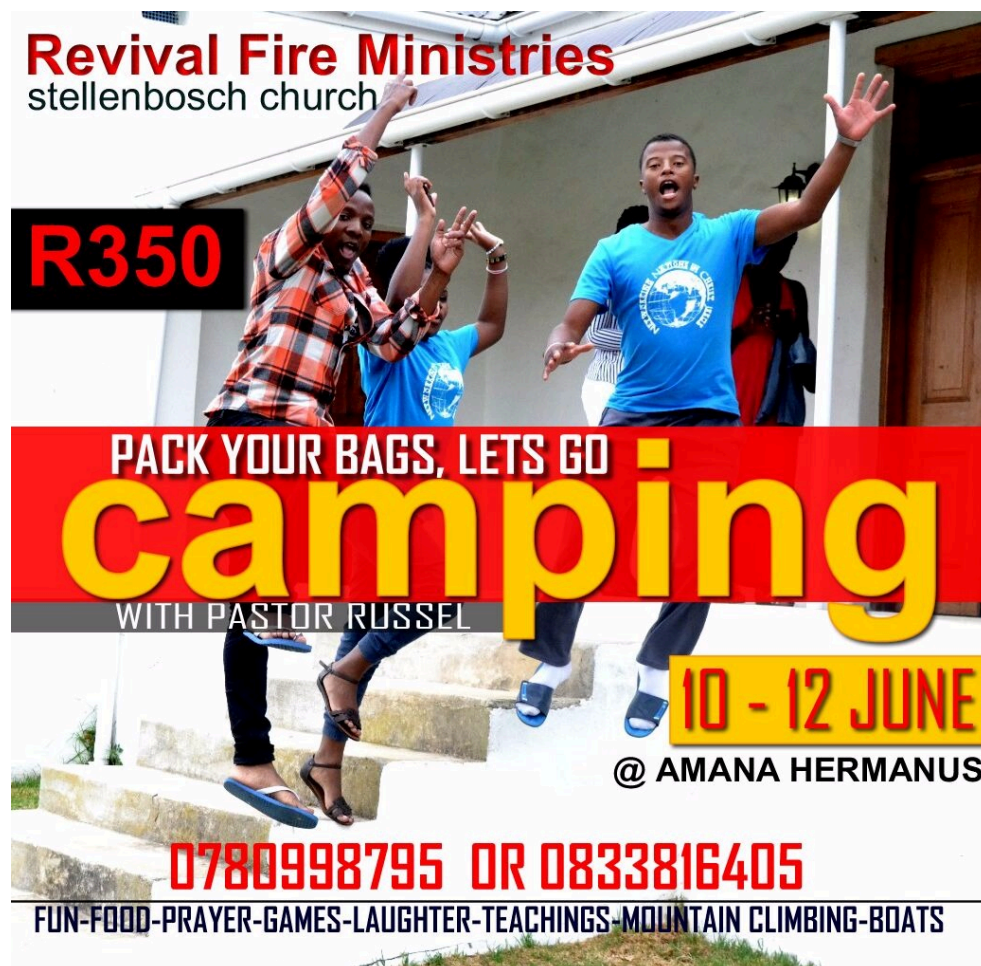
Photographie 8 : Flyer façonné par le pasteur Russel proposant un week-end en camping.