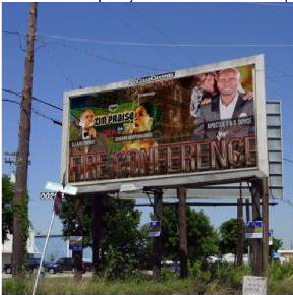
Photographie 9 : une affiche de la RFM dans la périphérie de Stellenbosch.

Un vendredi soir, je reçus sur WhatsApp, un message du pasteur Russel invitant chaleureusement tous ses fidèles à venir déguisés au prochain office. « Dimanche je vous propose une funny dressing competition ! Après la cérémonie, on fera défiler chacun d'entre vous et on élira la personne qui a été la plus inventive. Venez nombreux ! » Le jour J, tous les fidèles vinrent