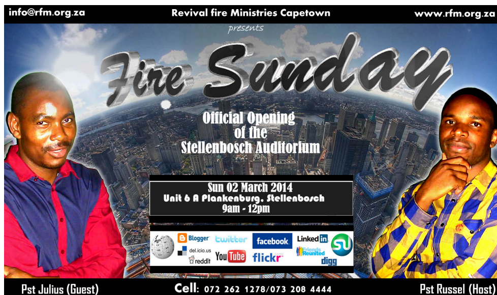
Photographie 15 : Flyer synchrétique confectionné par le pasteur Russel pour mettre en évidence sa fonction entrepreneuriale.

Cette compétition fait donc fonction, telle que l'exemple précédemment développé de la danse, de vecteur de sens existentiel légitimant, au niveau individuel, l'adhésion communautaire ainsi que la participation active à ce genre de fêtes. La dimension collective de ces moments d'extase ne doit pourtant nullement occulter, qu'elle alimente et amplifie, concomitamment et individuellement, là encore, dans une certaine mesure, le narcissisme. Cette compétition avait en effet alors amené ainsi la totalité des fidèles, systématiquement exaltés, à se prendre en selfie et à les diffuser aussitôt sur Facebook en tentant de prolonger le concours. Nous renvoyant à Pascal lorsqu'il statuait que « notre unique félicité est d'être en Dieu, et notre unique mal d'être séparé de lui », (1812).