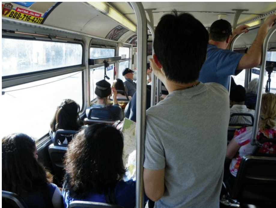
Photographie n°3 : Touristes dans un bus à Los Angeles.

Nous retrouvons ainsi pleinement, à travers ces trois brèves illustrations, le concept de « techniques du corps » introduit par Marcel Mauss, qu'il a pu définir comme « la manière dont les hommes de société en société savent comment utiliser leurs corps » (Mauss 2012, p. 365). En acceptant la définition de « technique » comme un « groupe de mouvements, d'actes en majorité manuels, organisés et traditionnels, concourant à obtenir un but connu comme physique, chimique ou organique » (Mauss 1969, p. 252), il faut alors effectivement admettre que le corps « est le premier et le plus naturel instrument de l'homme. Ou plus exactement, sans parler d'instrument, le premier et le plus naturel objet technique, et en même temps moyen technique » (Mauss 2012, p. 369)[4].