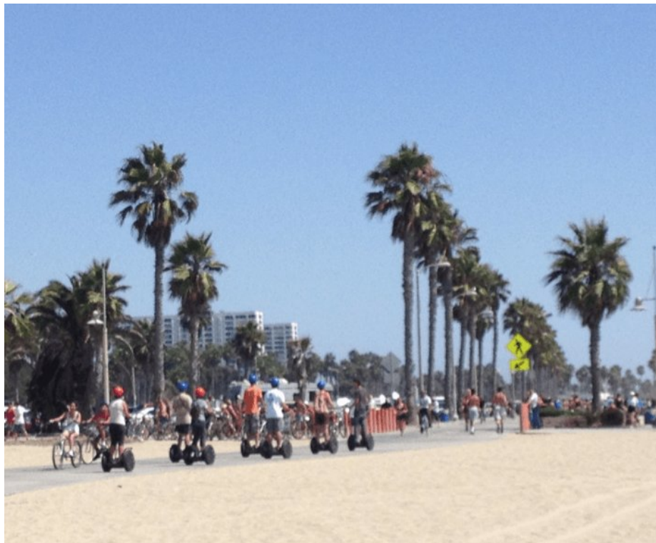
Photographie n°2 : Touristes utilisant des segway à Santa Monica.

souligne explicitement Paul Ricœur : « l'épreuve de force d'une philosophie de la volonté est sans discussion possible le problème de l'effort musculaire. Certes il y a un effort intellectuel, un effort de rappel des souvenirs, etc. ; mais en dernier ressort, c'est aux muscles que se termine le vouloir ; tout autre effort est finalement effort par sa composante musculaire, par la maîtrise sur le corps » (Ricœur 2009, p. 386). Que la maîtrise technique nécessaire pour sa réalisation soit uniquement celle du corps ou également celle de l'outil qui l'accompagne, le corps est toujours, en définitive, le garant ultime de la pratique. Prenons comme illustration à cette prise de position, et point de départ à notre argumentation, à nouveau une observation de terrain (photographie n°2), prise le 19 août 2012.