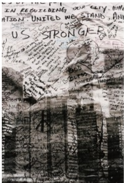
Illustration 7 : Grand panneau à écrire mis à la disposition des passants, New York (2001).

Il en va ici comme de nombreuses formes d'écriture collectives typiques, celle des pétitions, par exemple.