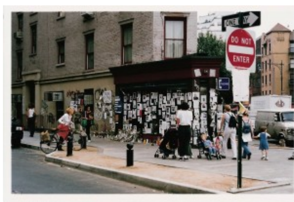
Illustration 4 : Réseaux d'écriture dans la ville, le semis des écrits pouvait apparaître toute la ville, New York (2001). Source : comme une manifestation des pouvoirs de Béatrice Fraenkel.

La fièvre d'écriture qui s'est emparée des New-Yorkais était visible partout, dans les grandes avenues comme dans les rues secondaires, sur les immeubles, dans les parcs, les stations de métro : la ville était parcourue d'un réseau d'écrits, stimulant tout autant la lecture que la prise d'écriture.