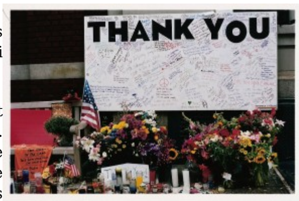
Illustration 5 : Panneau de remerciement devant une caserne de pompiers, New York (2001).

Enfin des promesses non adressées sont attestées, comme « We will never forget ». Un tel énoncé, bien qu'il soit une promesse de mémoire, peut être interprété d'une tout autre façon que les promesses adressées aux morts. Rien n'empêche de penser qu'il puisse être adressé aux responsables des attentats. La promesse « Nous n'oublierons jamais » devient alors une forme de menace.