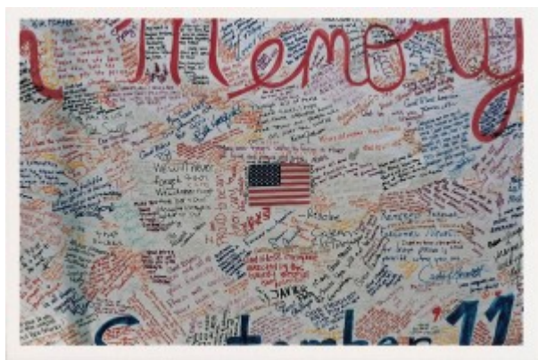
Illustration 6 : Légende. Source : Grand panneau à la mémoire des morts du 9/11, New York (2001).

Nous avons vu combien la question « qui promet ? » ne se laissait pas facilement résoudre. Le jeu entre le « We » des énoncés et la signature individuelle pouvait être source de confusion, mais ramenés à leur réalisation graphique, les énoncés écrits sur les panneaux, banderoles, registres rendent visibles une sorte de marqueterie d'écritures et de signatures, qui a la particularité de pouvoir être vue comme l'œuvre d'un collectif et comme l'agrégat de plusieurs signes individuels.