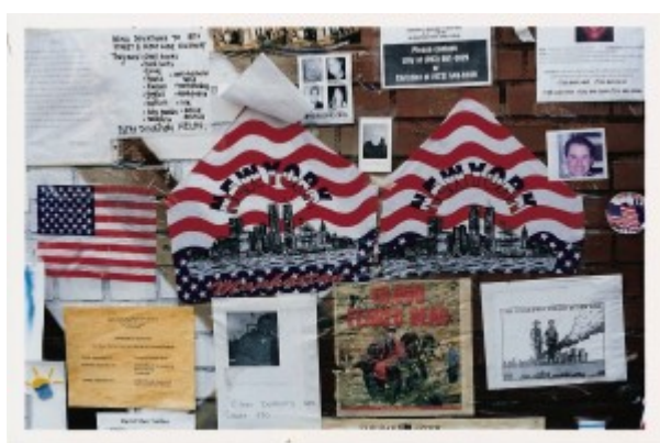
Illustration 2 : Multiplicité des écrits affichés. Avenue A, New York (2001).

La plupart des écrits ont été fabriqués à la hâte, sans soin sur des supports fragiles, les graphies sont souvent brouillonnes (Illustration 3).