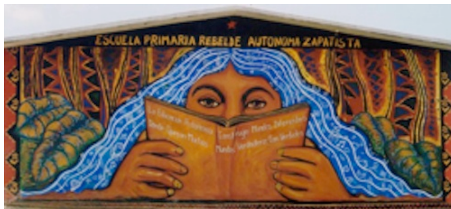
Figure 1. Photo d'une école primaire en territoire autonome zapatiste (Stéphane Guimont Marceau, mai 2004).

Sa principale stratégie est composée de communiqués de presse largement diffusés aux échelles locale, nationale et internationale (Galland, 2008). Le récit qui nous intéresse s'insère dans cette diffusion. Le mouvement zapatiste a sans doute été le premier mouvement social à utiliser Internet de façon massive afin de propager son message à l'échelle transnationale. Cette stratégie leur a servi : le mouvement jouit, dès les premiers jours de son insurrection, d'un fort niveau de sympathie qui oblige le gouvernement mexicain à s'asseoir avec lui pour négocier. Depuis, les dirigeants du mouvement misent sur les médias écrits, radio et vidéo, pour apparaître dans une sphère publique de laquelle ils étaient exclus.