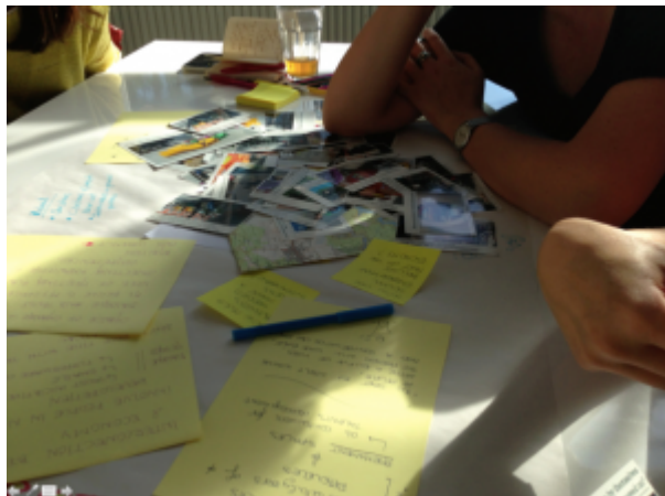
Image 1 : Observation d'une formation aux méthodes participatives à Amsterdam (2013).