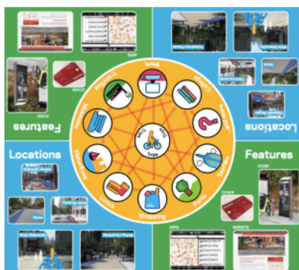
Image 2 : Plateau de jeu utilisé pour les ateliers de conception participative du système de bike share.