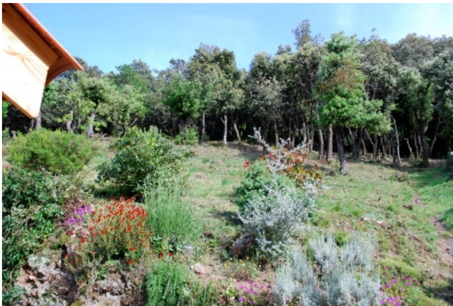
Photo 2 : périmètre débroussaillé et déboisé autour d'une habitation en bordure du Domaine des Albères (cliché : Ch. Bouisset).

Malgré les contrôles, on constate également que toutes les habitations sont loin de satisfaire aux normes ainsi édictées. Ceci est particulièrement vrai pour les résidences secondaires dont certaines ne sont absolument pas entretenues. Dans l'immense majorité des cas, on constate que le respect de l'obligation de débroussaillage n'est que partiel. Ce non-respect relève de deux catégories d'explication : l'incompréhension des normes et une résistance plus ou moins active à leur application. Le premier cas de figure est observé dans quelques jardins : il témoigne de l'incompréhension de certains termes techniques employés dans les brochures d'information du public, notamment par des propriétaires étrangers. Ainsi, dans deux cas observés, l'obligation d'élaguer les arbres à deux mètres de hauteur a-t-elle été mal comprise et les arbres étêtés, laissant dans le jardin des « poteaux » de deux mètres de haut (Photo 3). D'autres difficultés tiennent à l'interprétation et à la transposition des consignes théoriques sur le terrain pour savoir, par exemple, quels végétaux éliminer ou quels sujets peuvent être conservés.