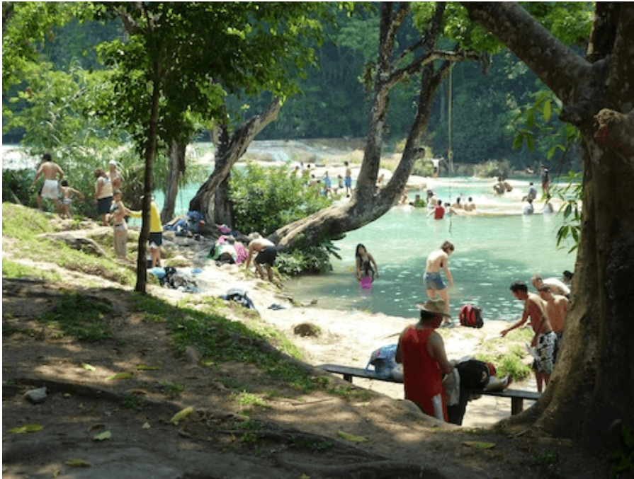
Les Cascades d'Agua Azul, espace-enjeu.

Héritée de plus d'un siècle d'histoire agraire, la situation actuelle au Chiapas est caractérisée par une confusion extrême quant aux régimes juridiques de propriété du sol, situation résumée en ces termes par Daniel Villafuertes : « En un mot, on a généré une situation anarchique quant à la possession de la terre [...] : le droit juridique a perdu son sens, favorisant l'usage de la force comme moyen de pression politique ou de répression » (2002, p. 39)[19]. Dans ce contexte, posséder une terre implique souvent pour les populations rurales du Chiapas (qu'elles soient zapatistes ou non) d'être en mesure de s'organiser pour l'occuper, se l'approprier et, si besoin, la défendre. L'appartenance à une force politique devient un enjeu non réductible à un choix idéologique, enjeu étroitement lié au contexte agraire et matériel local. Face à la crise que traverse le secteur agricole, le tourisme apparaît, pour une partie des populations rurales, comme une alternative à la pauvreté ou à l'immigration. Dès lors, les espaces touristiques deviennent des espaces-enjeux, et les luttes de pouvoir pour leur contrôle semblent contribuer à dessiner une nouvelle géographie des conflits au Chiapas.