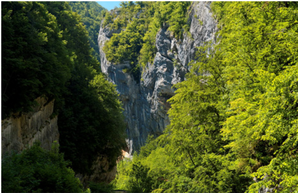
Illustration : Bruno Monginoux, « bourne-canyon-03 », Flickr (licence Creative Commons).

Par : Clémence Perrin-Malterre et Jean-Pierre Mounet | date de parution : lundi 14 septembre 2009